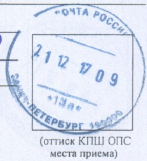
(оттиск КППШ ОПС места приема)

Принял: _____ (должность) _____ (подпись) _____ (Ф.И.О.)